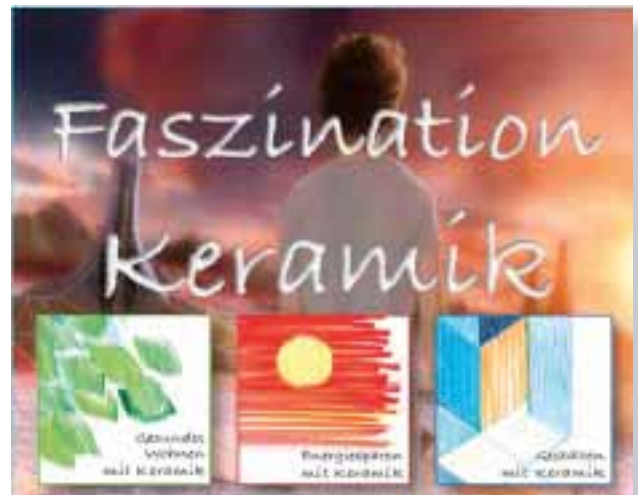
Video „Faszination Keramik“