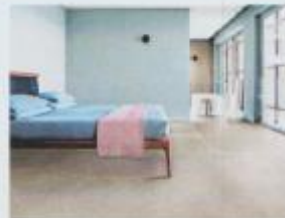
Wände und Böden sollten wohngesund gestaltet sein.

Die Auswahl an Wand- und Bodenbelägen ist groß, ganz allgemein kann man zwischen künstlich-chemischen Produkten und natürlichen Materialien unterscheiden. Zu Letzteren zählt Keramik. Sie gehört zu den ältesten Baustoffen. Schon in der Antike kam der natürliche Werkstoff, der aus Ton, Feldspat und Kaolin besteht, zum Einsatz. Kaolin