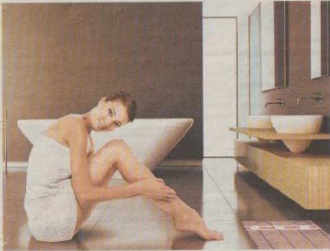
Aufgrund der natürlichen Strahlungswärme einer Flächenheizung kann die durchschnittliche Raumtemperatur ohne Einbußen beim Komfort deutlich gesenkt werden.