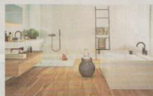
Keramische Fliesen sind besonders leicht zu reinigen, absolut hygienisch und lösen keine Allergien aus.

falls keramische Fliesen. Durch die Kombination von Fliesen mit rutschicher Oberflächenstruktur, der Breite und Anzahl ihrer Fugen sowie dem angepassten Fliesenformat können Duschen und Boden sicher und lachlich gestaltet werden. Ein spezieller Fugenmörtel fürs Bad garantiert Langlebigkeit und Pflegeleichtigkeit. Ihre Funktionalität überzeugt im Bad und somit auch im Alltag.