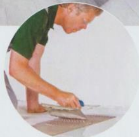
KERAMISCHE FLIESEN, DIE MIT KLEBE- SOWIE FUGENMÖRTEL DER QUALITÄTSGÜTE EC1+ VERARBEITET WERDEN, BEIHALTEN KEINE FLÜCHTIGEN ORGANISCHEN SUBSTANZEN, DIE SCHÄDLICH FÜR DIE WOHNUNGSGESUNDHEIT SIND.

ser weggewischt. Vor allem aber können sich auf Keramik keine allergenen Stoffe wie Staub, Milben und Pollen entwickeln oder einnisten. Daher sind Keramikfliesen in Küche und Bad, aber auch im Wohn-, Schlaf- oder Arbeitszimmer bestens für Allergiker sowie für alle, die Wert auf eine gesunde Lebensweise legen, geeignet. Auch mit seinen vielfältigen, lichtechten und ungiftigen keramischen Farben trägt das feuerfeste Material zu einer wohngesunden Atmosphäre bei. Klebe- und Fugenmörtel der Qualitätsgüte EC1+ garantiert, dass keine flüchtigen organischen Substanzen verarbeitet wurden, die schädlich für die Gesundheit sein